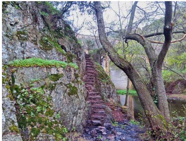
Bajada a la Cascada del Hervidero