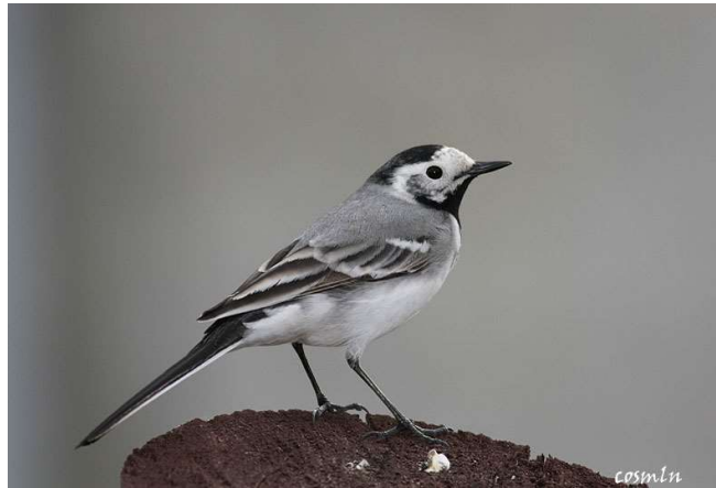
Lavandera blanca ( Motacilla alba )

Y estamos a menos de 40 kilómetros de Madrid.